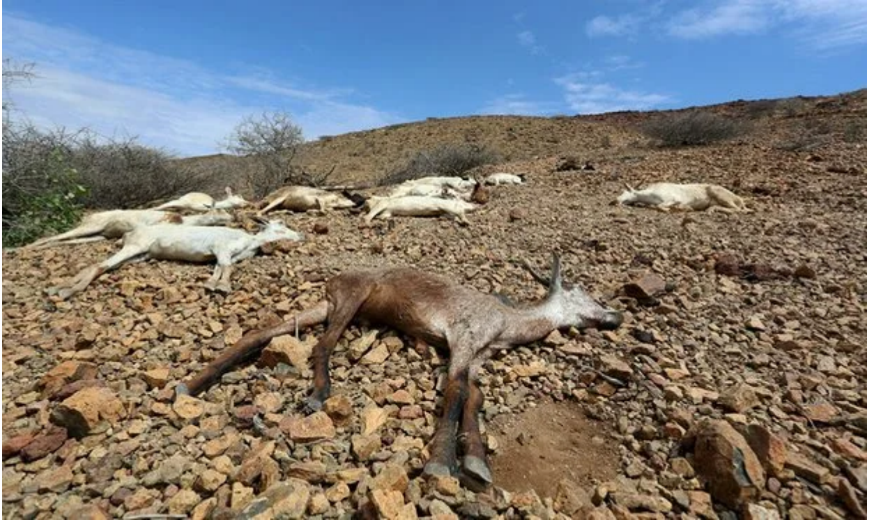
ترجمة حفصة جودة

حذر البنك الدولي يوم الثلاثاء من أن نقص المياه سيوجه ضربة قاسية لاقتصاد الشرق الأوسط ووسط آسيا وإفريقيا بحلول منتصف القرن الحالي، وقد يؤدي ذلك أيضاً إلى حذف رقمين من إجمالي الناتج المحلي.