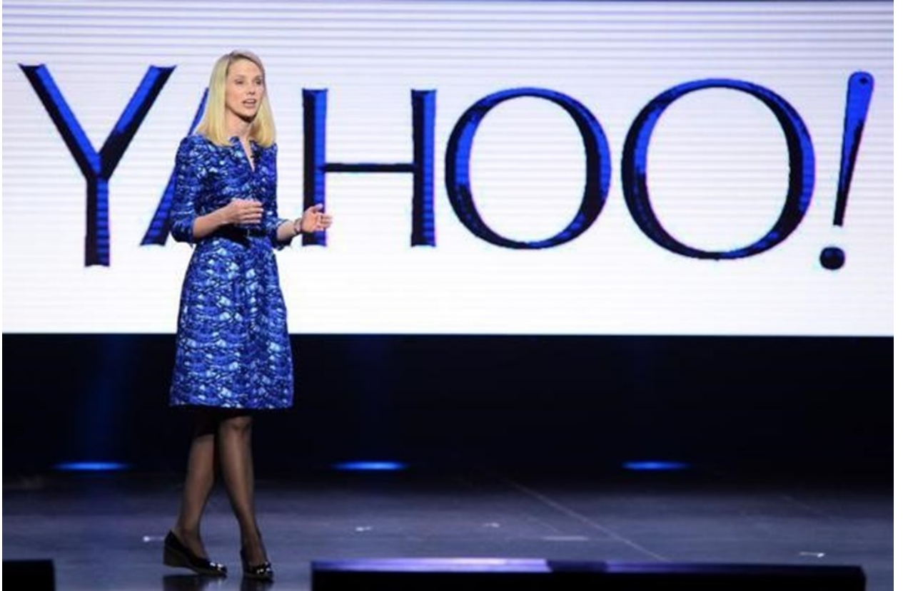
ماريسا ماير- المديرية التنفيذية لشركة ياهو

وبهذا تكون ياهو فقدت بريقها الذي تمتعت به في وقت ما حيث كانت تتربع في القمة بعدما اعتبرت أول من أطلقت خدمة المحادثات الفورية في ياهو مسنجر ومحرك البحث الذي كان قد استحوذ على حصة سوقية كبيرة وخصوصًا في فترة التسعينيات وكان الموقع الوحيد الذي يمد الأسواق بالأخبار السياسية والاقتصادية والفنية والرياضة والترفيه وغيرها، وقد بلغت قيمة الشركة السوقية في ذلك الوقت 140 مليار دولار بينما وصلت الآن قيمتها إلى 37 مليار دولار فقط وما تم بيعه لشركة فيرزن بقيمة 4.83 مليار دولار.