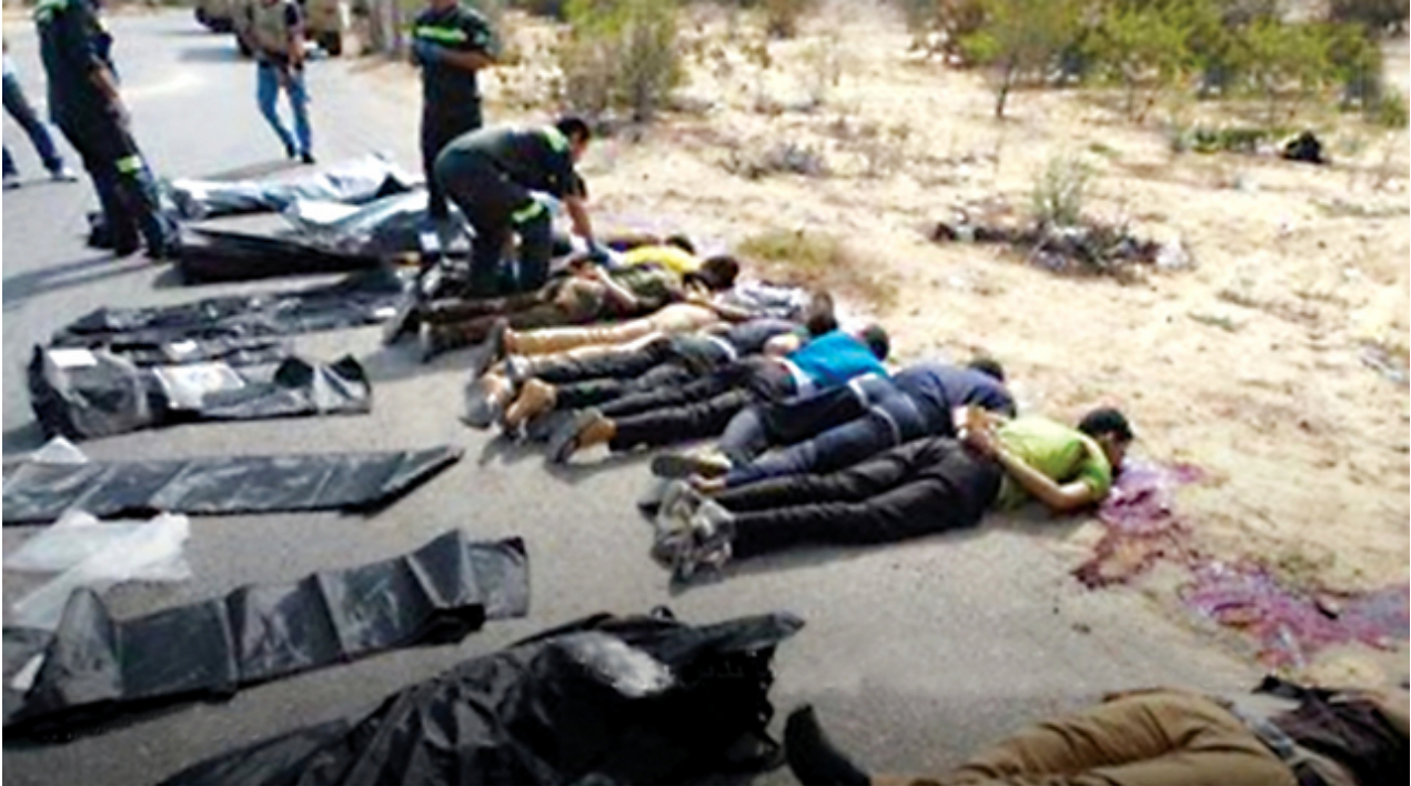
مذبحة رفح الثانية التي راح ضحيتها 25 جنديًا مصريًا خلية عرب شركس

توقيت تنفيذ الحكم الذي يأتي بعد ثلاثة أيام من تفجير كنيسة البطرسية بمنطقة العباسية بالقاهرة والذي أودى بحياة 25 قبطيًا، هو أيضا مثير تساؤل، فليس من العادة أن يتم تنفيذ الحكم بعد ساعات قليلة من تأييده، إلا أن هذا التوقيت كان بلا شك محاولة لتهدئة الشارع القبطي والرأي العام، وإعطاء رسالة للعالم بأن ما يُردده النظام من مصطلحات كـ "محاربة الإرهاب" في مصر تسير على قدم وساق.