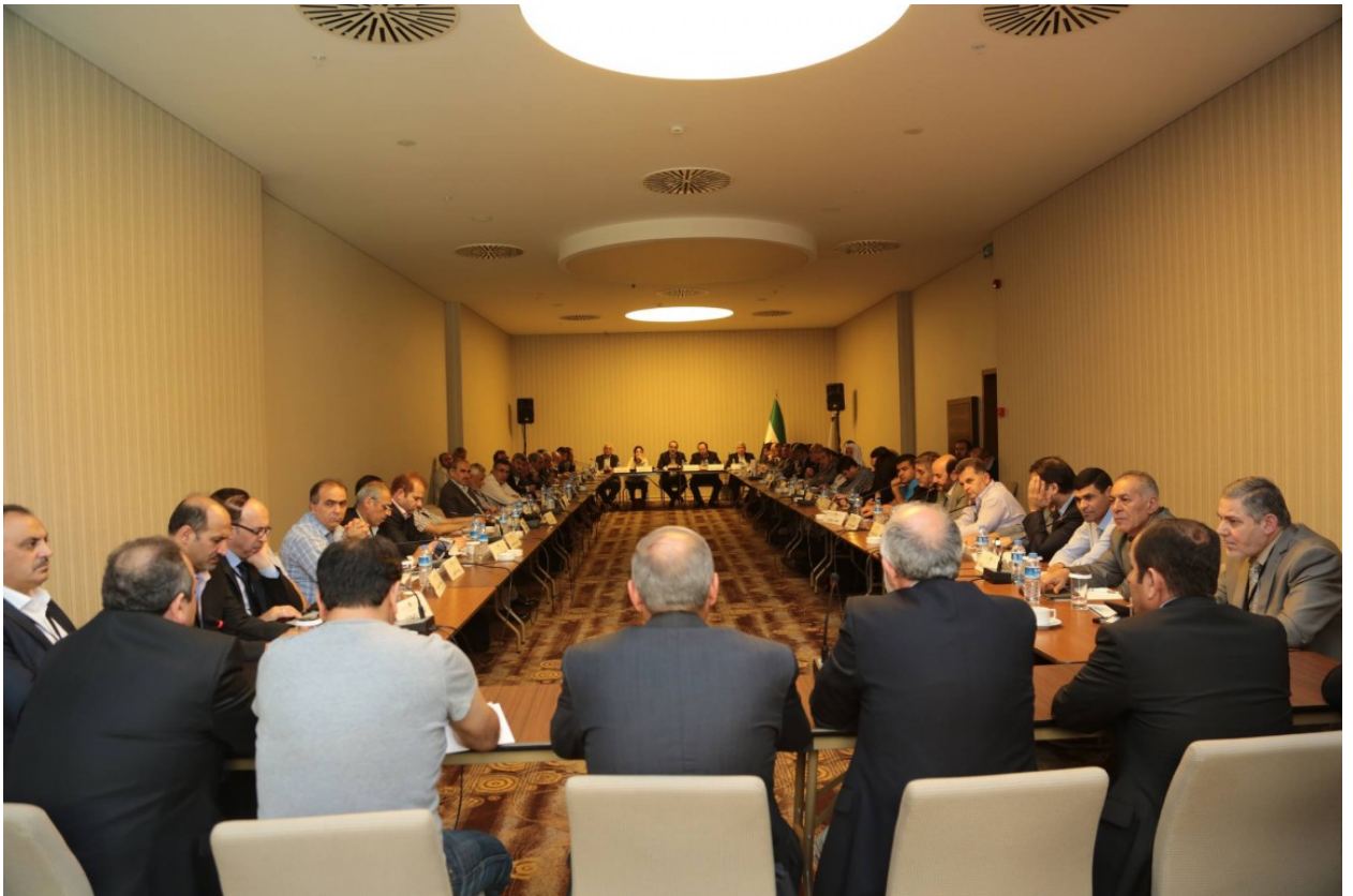
مؤتمر العين السخنة بمشاركة رجال أعمال وسياسيين فلسطينيين ومصريين

ثم وصلت خطوات التقارب بين الجانبين مرحلة من الإيجابية حيث نظمت مصر مؤتمراً اقتصادياً بمنطقة العين السخنة بمحافظة السويس، في الثلاثين من أكتوبر الماضي، استمر يومين كاملين، ثم مؤتمراً آخر في التاسع من نوفمبر، شارك فيهما ما يقرب من مئة رجل أعمال من قطاع غزة، لبحث سبل تعزيز التعاون الاقتصادي بين القاهرة والقطاع، إضافة إلى ما تردد بشأن الحديث عن إقامة منطقة تجارة حرة في مدينة رفح، القائمة على طرفي الحدود، ما يُمكن التجار في غزة من شراء المنتجات مباشرة من الطرف المصري من المدينة، وهذه الخطوة ستكون بمثابة رفع جزئي للحصار المفروض على القطاع.