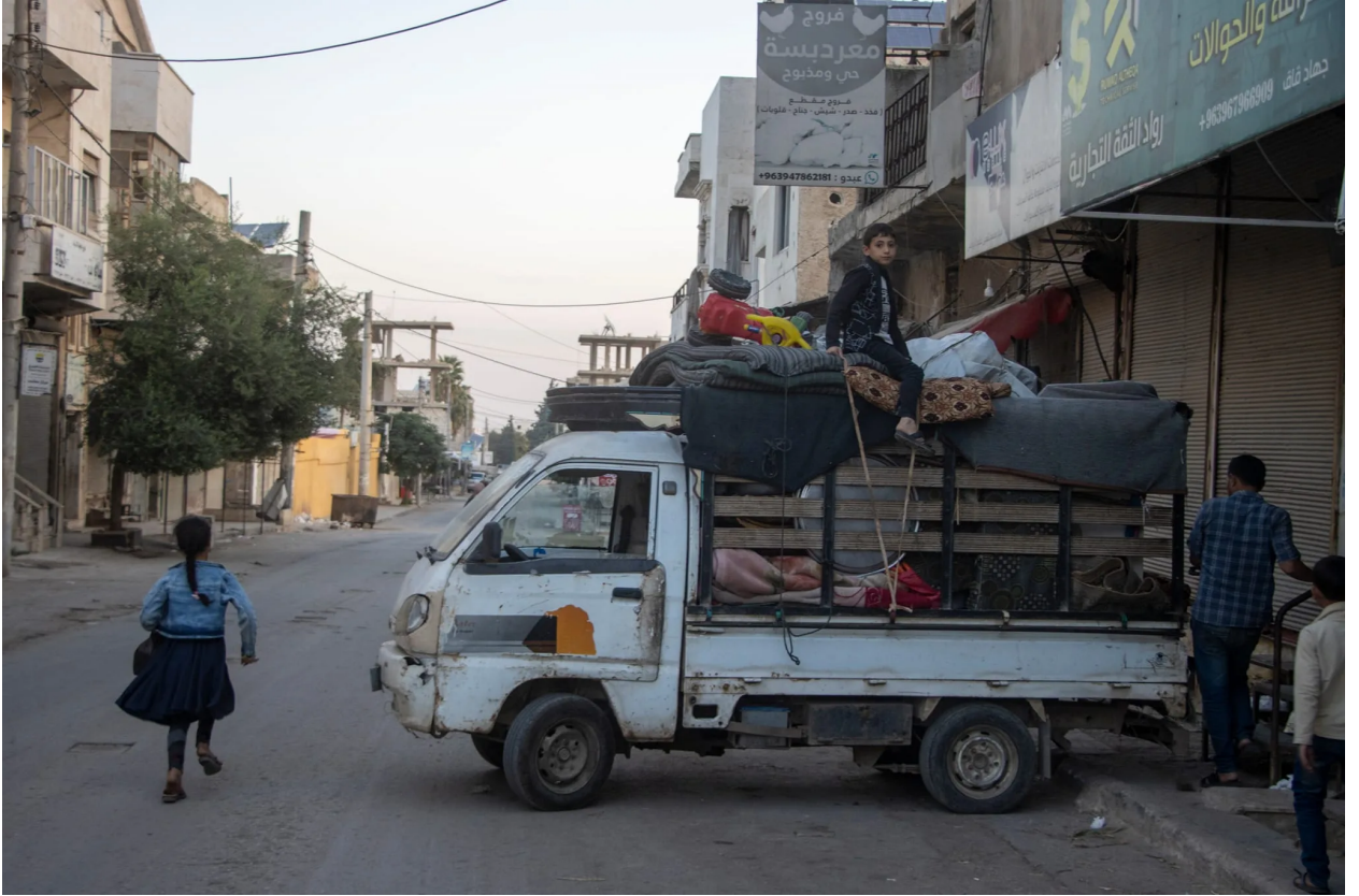
نزوح الأهالي من مدن وبلدات ريف إدلب جراء قصف نظام الأسد

تسبب قصف نظام الأسد الهيستيري على مدن وبلدات في ريف إدلب، في حركة نزوح جديدة للأهالي، في ظل أزمة إنسانية غير مسبوقة يعيشها السوريون مع حركة النزوح المتكررة نتيجة انعدام الاستقرار، ما يجدد مآسئهم، في حين لا تزال آلاف العائلات في منازلها رغم انعدام سبل الأمان في ظل تجدد قصف نظام الأسد.