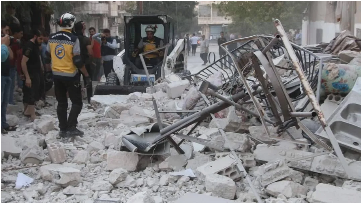
آثار القصف الجوي على مدينة أريحا التابعة لمحافظة إدلب

كما تعرضت بلدة سرمين شمالي مركز المحافظة، لقصف صاروخي، تسبب في مقتل 4 مدنيين بينهم طفل، وأصيب نحو 31 مدنيًا ضمن هجمات صاروخية متكررة، كما قتل طفل وأصيب آخرون، في قرية جفتلك قرب جسر الشغور جراء قصف جوي استهدف القرية، وقتل رجل وأصيب مدنيان، في قرية مجدليا بريف إدلب، وقتل مدني وأصيب اثنان آخران في مدينة دارة عزة، غرب مدينة حلب.