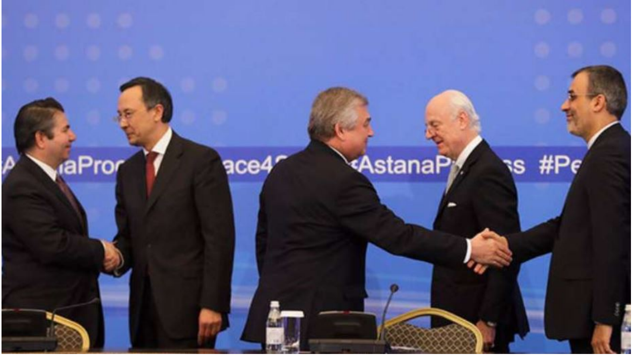
ديمستورا وممثلي روسيا وتركيا وإيران في مؤتمر أستانة 4

المنشورة لمناطق خفض التصعيد غير صحيحة ولن تكون مقبولة وأكد في بيان له أن الوفد لم يتفاوض على أي خصائص بهذا الشأن ولم تعرض عليه في أية اجتماعات، وبين أنه لا يمكن أن يقبل استثناء أي منطقة من اتفاق وقف النار خصوصًا المناطق المحاصرة.