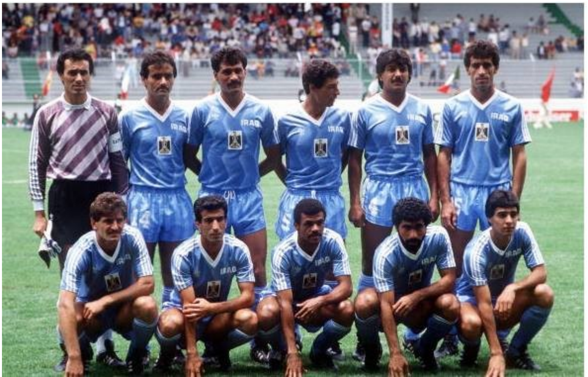
المنتخب العراقي في كأس العالم 1986