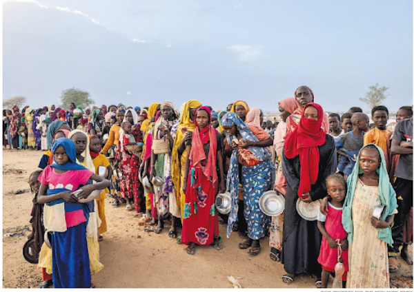
FROM PAGE A1 FOR THE NEW YORK TIMES

Declan Walsh reported from Sudan, Chad and Switzerland. Christoph Koeltl analyzed satellite images, flight records and other materials. Julian Barnes and Eric Schmitt contributed reporting from Washington, and Shaub Almosawa from Bangalore, India.