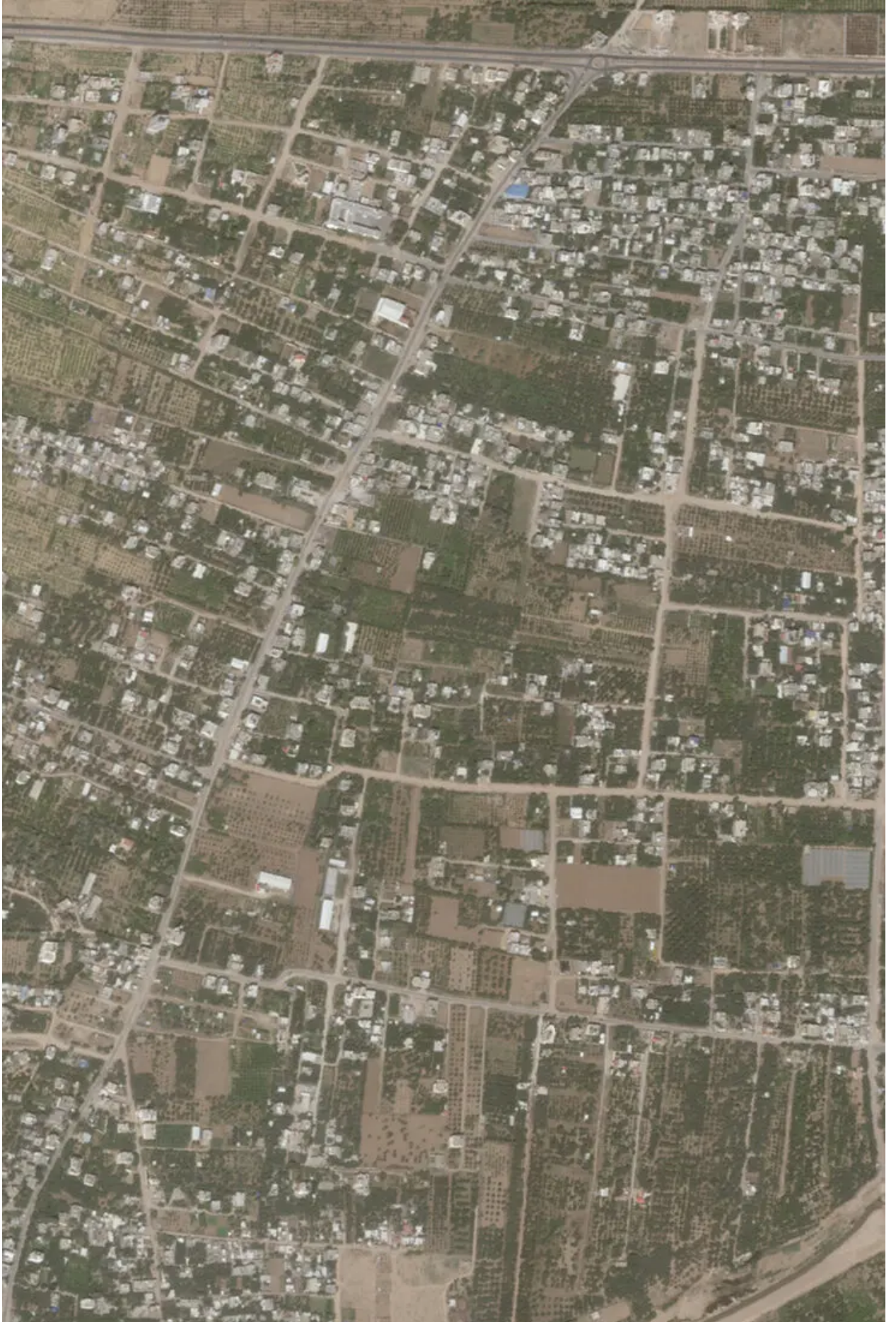
تُظهر صور الأقمار الصناعية التي التقطتها شركة "بلانيت لابز" في مايو/ أيار 2023 قبل الحرب