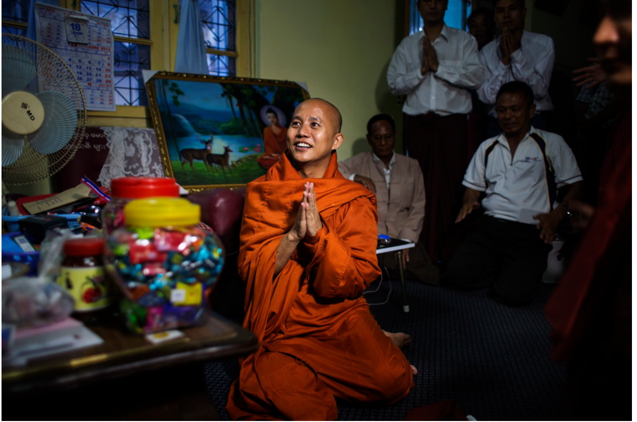
الراهب البوذي الراديكالي آشين ويراثو

ارتبط ويراثو في بداياته بمنظمة "969"، التي يقول أنصارها إن رقم 9 الأول يرمز إلى السمات الخاصة ببوذا، أما الرقم 6 فيشير إلى الشخصيات الخاصة في التعاليم البوذية، ورقم 9 الأخير يمثل صفات جماعة الرهبان.