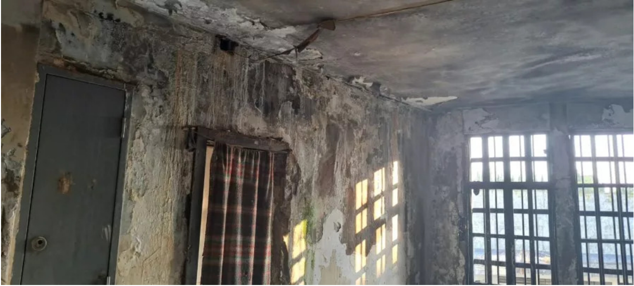
سجن رومية (القدس العربي)

وبينما تفتقر هذه التهم إلى أدلة قانونية دامغة، يتعرض المتهمون لانتهاكات متعددة، من بينها غياب الإجراءات القانونية الصحيحة وهو ما يبقيهم في حالة انتظار لا نهائية. يعد الواقع داخل السجن نموذجًا صارخًا لأقصى انتهاكات حقوق الإنسان، حيث تتراوح أشكال المعاناة بين التعذيب أثناء التحقيق، والإهمال الصحي، والحرمان من الدواء، ونقص الطعام. وهو ما أدى إلى تفشي الأمراض والأوبئة بين السجناء. حيث وصف المعتقلون في بيانهم الأخير المنشور الثلاثاء 11 فبراير/شباط ظروفهم في سجن رومية بأنها "صراع يومي للبقاء على قيد الحياة".