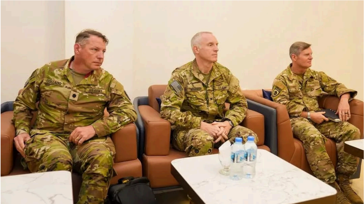
من اليسار: المقدم جيمس كولاكو من قيادة العمليات الخاصة للجيش الأمريكي في أفريقيا - بوساسو؛

وقالت مصادر أميركية مطلعة ومسؤولون في إدارة بونتلاندا لـ "ميدل إيست آي" إن الإمارات تستخدم بوساسو كمحطة إمداد لقوات الدعم السريع في السودان، بينما تستخدمها الولايات المتحدة كمنصة لتنفيذ عمليات داخل الصومال. وفي 10 نوفمبر/ تشرين الثاني، قبل ثلاثة أيام فقط من تصريحات روبيو التي أدان فيها جرائم قوات الدعم السريع في الفاشر، نفذت القيادة الأميركية في أفريقيا (أفريكوم) غارة جوية ضد تنظيم الدولة في الصومال قرب كهف غولغول، على بعد 32 كلم جنوب شرقي بوساسو. ومنذ وصوله إلى السلطة، أشرف الرئيس ترامب على "تصعيد غير مسبوق" في الحرب الأميركية ضد الإرهاب في الصومال، وفق مركز "نيو أميركا"، إذ نفذت إدارته 99 ضربة هذا العام، مقابل 51 ضربة خلال إدارة بايدن. وتشكل هذه الضربات، التي أطلقت كثيرًا منها من سفن حربية أميركية في المنطقة، جزءًا من هجوم واسع تشنه إدارة بونتلاندا على تنظيم الدولة بدعم أمريكي وإماراتي. وتكشف بيانات تتبّع الرحلات الجوية، التي حثّلتها "ميدل إيست آي"، عن وجود ارتباط مباشر بين قاعدة بوساسو والقواعد الأميركية الرسمية في المنطقة.