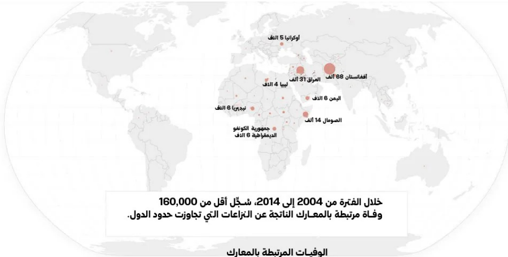
الوفيات المرتبطة بالمعارك