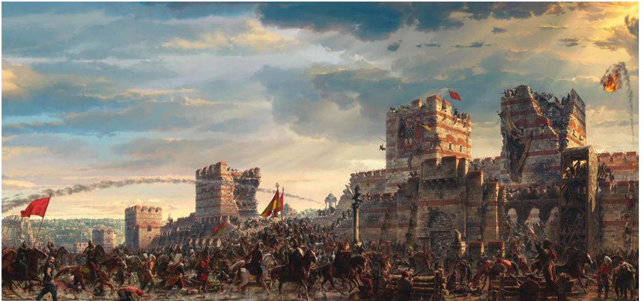
جزء من اللوحة البانورامية

يحكي المتحف قصة إسطنبول بدءاً من تأسيسها وحصارها ومن ثم فتحها وحياة محمد الفاتح، إضافة إلى الفنون والثقافة المزدهرة في إسطنبول، وذلك من خلال المعرض الذي يعرض اللوحات والمجسمات التي تمثل كل ما سبق.