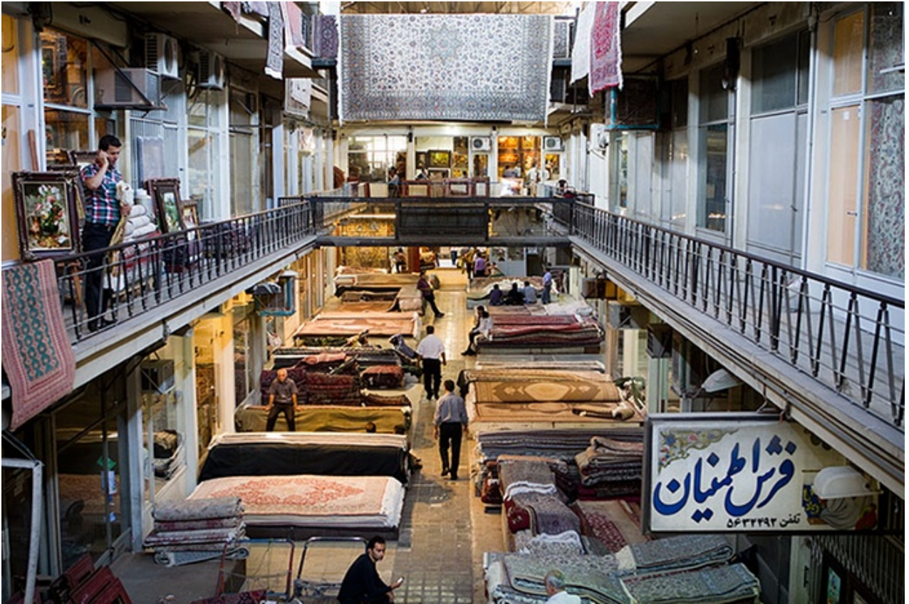
سوق السجاد في طهران