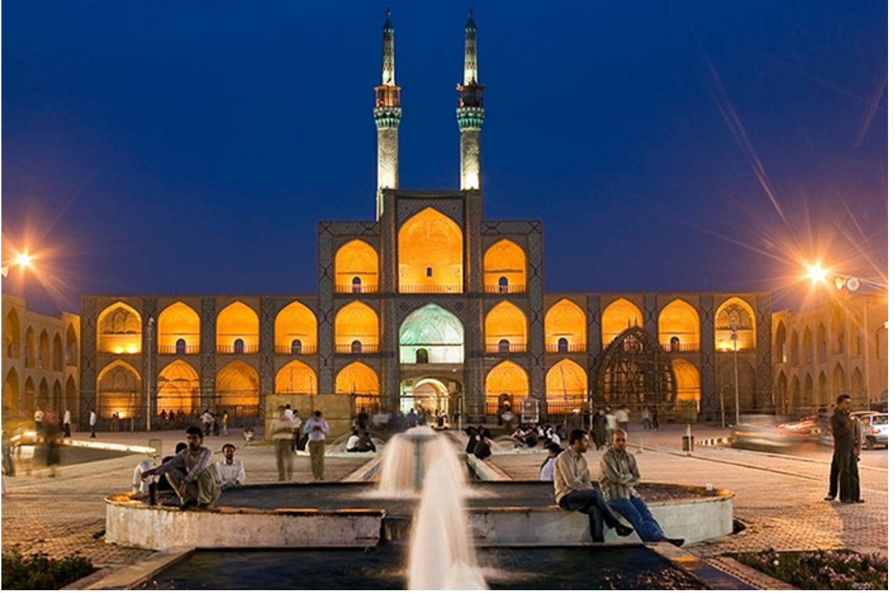
ميدان أمير شاهماق، موجود منذ القرن التاسع في قلب إيران، وهي مركز الثقافة الزرادشتية